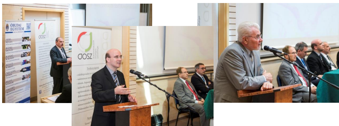
A megnyitó képekben